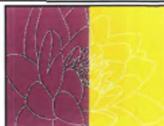
Guide pratique d'Aromathérapie Familiale et scientifique par Dominique Baudoux

NB : ce livre nous a permis de connaître une nouvelle huile essentielle remarquable : le Mandragorasotra ou Sero et que nous appellerons donc l'HE de Sero. Nous vous la présentons dans cette lettre en page 12.