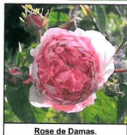
Rose de Damas.

Vous pouvez également en faire un usage plus régulier dans la journée. Dans ce cas, diluez 10 gouttes HE Rose dans 10 ml (une cuillère à soupe) HV Noyaux d'abricot, et appliquez 3 gouttes du mélange trois fois par jour sur des zones nerveuses stratégiques du corps.