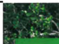
Mandravasarotra ou Saro Cinnamomum fragrans